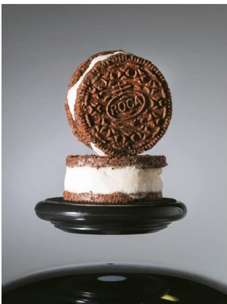
01 | Geliebte schwarze Trüffel (aus) | Desserts aus weißer Trüffel und Parmesan 02 | Eiscreme

560 Seiten | Hardcover | 24 cm x 32 cm | Matthaes-Verlag | ISBN: 978-3-87515-423-8